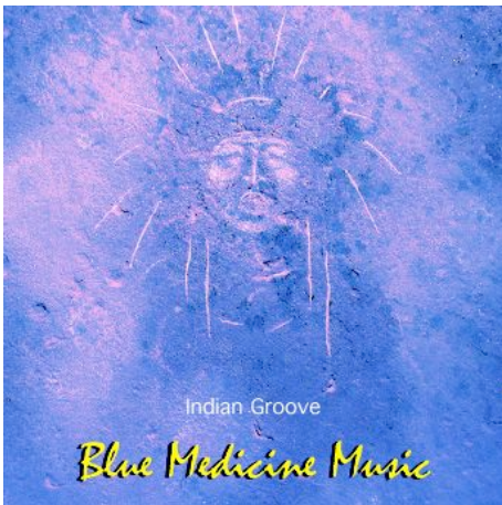
2005 "Indian Groove"